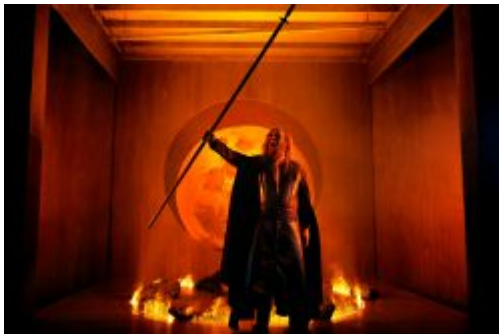
Wotan umgibt Brünnhilde mit einem Feuerkreis

Zum nunmehr zehnten Mal hat man hier parallel zu den Festspielen eine Produktion speziell für Kinder von 7-12 Jahren entwickelt: Ein Werk Wagners, das auf das Wesentliche gekürzt, für das jugendliche Publikum verständlich und nachvollziehbar dargeboten und zudem unter Einbeziehung Heranwachsender und Studierender erarbeitet wurde. So waren bei dem Entwurf der ausgesprochen stimmig wirkenden Kostüme Duisburger Schüler beteiligt, in Bezug auf die Maskenbildung existiert eine Partnerschaft zur Theaterakademie August Everding, München, im Bereich der Regie zur Hochschule für Musik Hanns Eisler, Berlin.